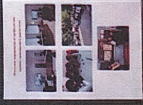
Схема-маршрут безопасного движения детей на территории р.п.Цыганка

Документ с печатью и подписью, содержащий информацию о мероприятии.